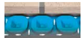
BEHEER VAN DAMPEN